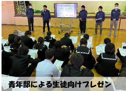
青年部による生徒向けプレゼン