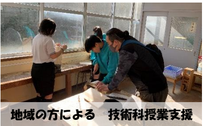
地域の方による 技術科授業支援