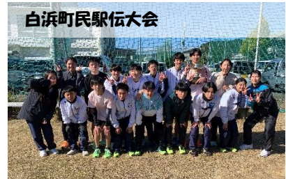
白浜町民駅伝大会