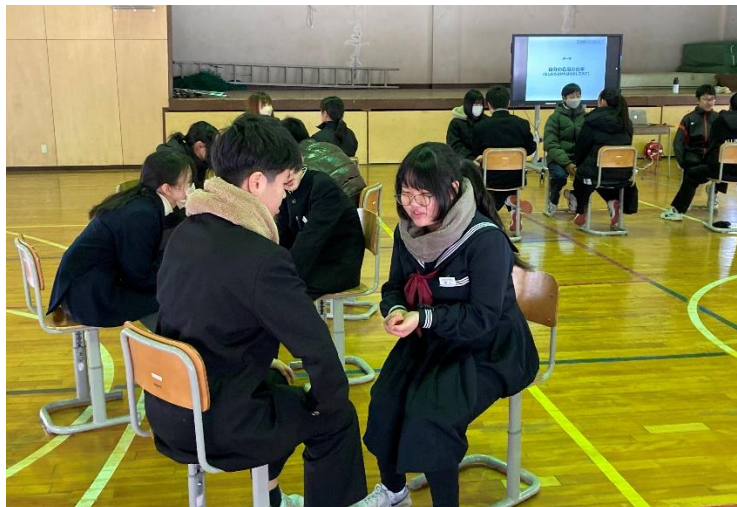
対話のフォークダンス 偶然一緒になった人との対話がはずむ