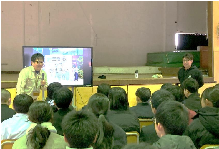
1年、2年で実施、「見方・考え方」講座 3年は今月実施予定!