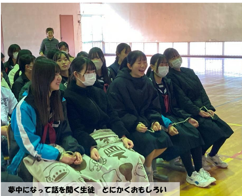
夢中になって話を聞く生徒 とにかくおもしろい