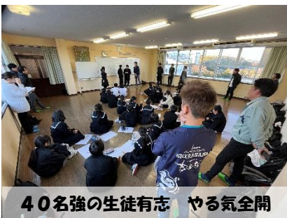
40名強の生徒有志 やる気全開

4月6,7日に行われる白浜商工祭で、本校1,2年生の有志が、白浜商工会青年部の方と一緒に、出店することとなりました。青年部の方の伴走いただきながら、ゼロからの立ち上げです。楽しみ！