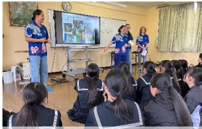
オーストラリア マランダクイズ!