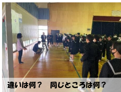
違いは何? 同じところは?

1年生の授業では、自分と他者との「いじめ」認識が違うこと、絶対に許されない行為があることを学びました。