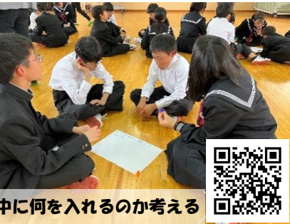
中に何をを入れるのか考える