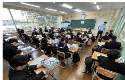
少し緊張している新入生