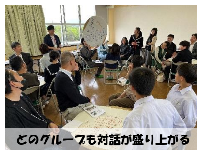
どのグループも対話が盛り上がる