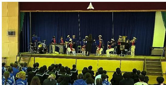
新入生対象の部活紹介 吹奏楽部の演奏