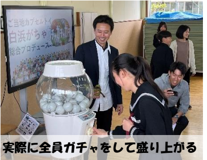
実際に全員ガチャをして盛り上がる

高校生のプレゼンに続き、いくつかのグループに分かれ、自己紹介など対話を行いました。今後、オンライン授業交流も始まります。