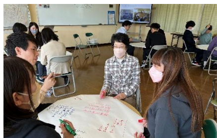
行きたくなる学校を考える教職員