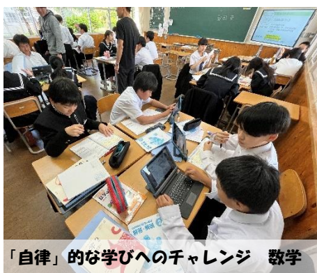
「自律」的な学びへのチャレンジ 数学

そのためには、①画一的な教育から、「個を軸とした学び方」への転換②「実際の社会とつながる授業内容を軸とした学び方」への転換③課題解決力を身につけるための「探究型を軸とした学び方」への転換などが必要です。