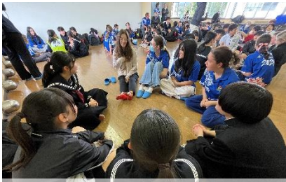
どのグループも対話が盛り上がる