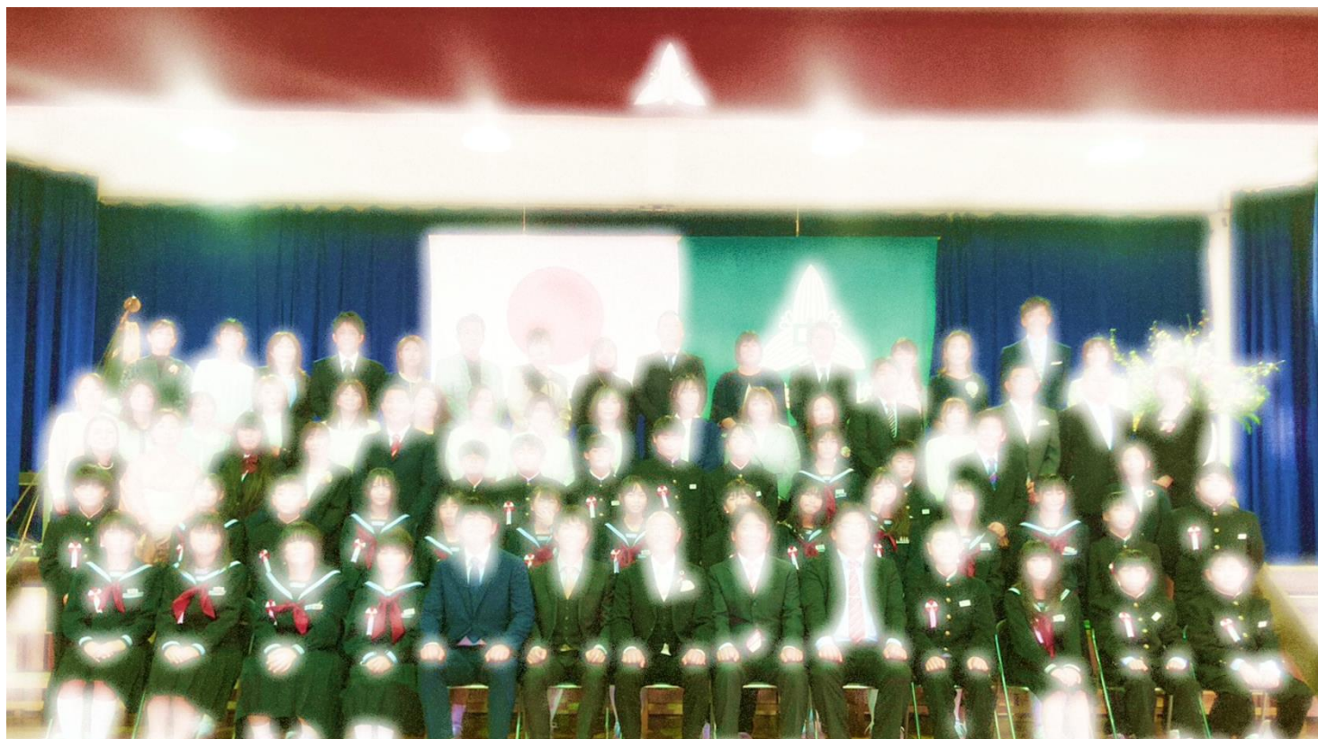
29名の新入生を迎え、全校生徒100名、教職員等23名で、令和6年度がスタートしました。新しいご縁に感謝いたします！