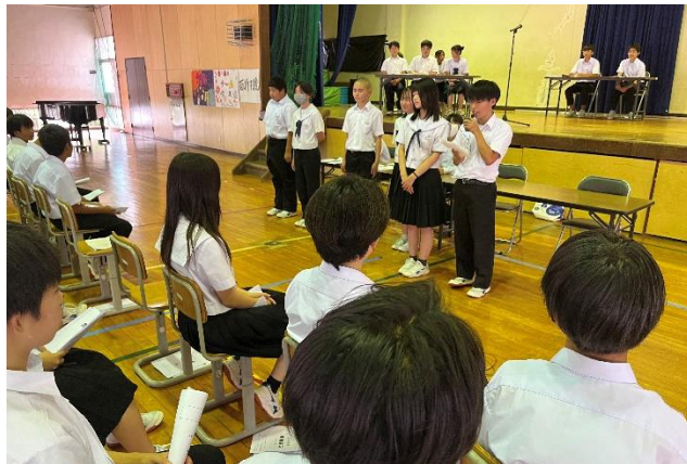
決意表明をする全学年の中央委員 右学級のスローガン