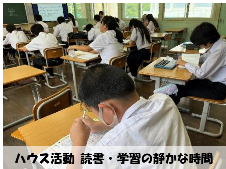
ハウス活動 読書・学習の静かな時間