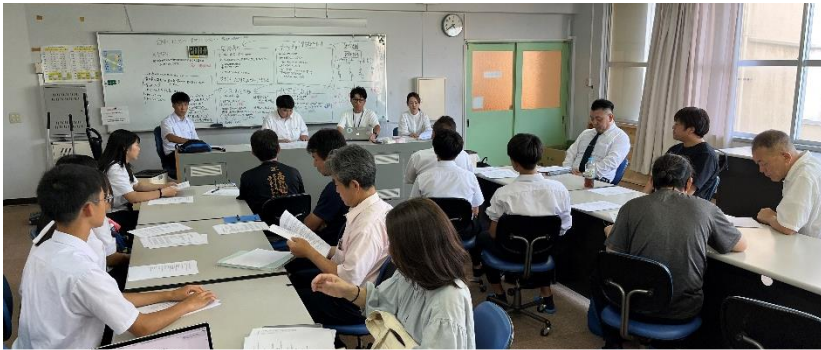
第2回実行委員会の様子 生徒のアイデアを実現する方向ですんでいる

白浜中学校コミュニティスクールの1つの活動として、生徒提案「白中夏祭り」のプロジェクトが進んでいます。8月31日(土)に、本校中庭をメイン会場に、屋台部(公民館、商工会青年部、白浜コスモスの里等のご協力)、ダンス部(白浜婦人会との盆踊りプロジェクト、みんなで踊るダンス企画、有志生徒ダンス発表)、教室企画部(南紀オレンジサンライズさん、公民館のご協力で縁日的なもの、育友会の出し物など)、広報部に分かれて計画を進めています。当日、ご協力いただける方も募集していますので、よろしくお願いいたします(白浜中学校 42-2444)。