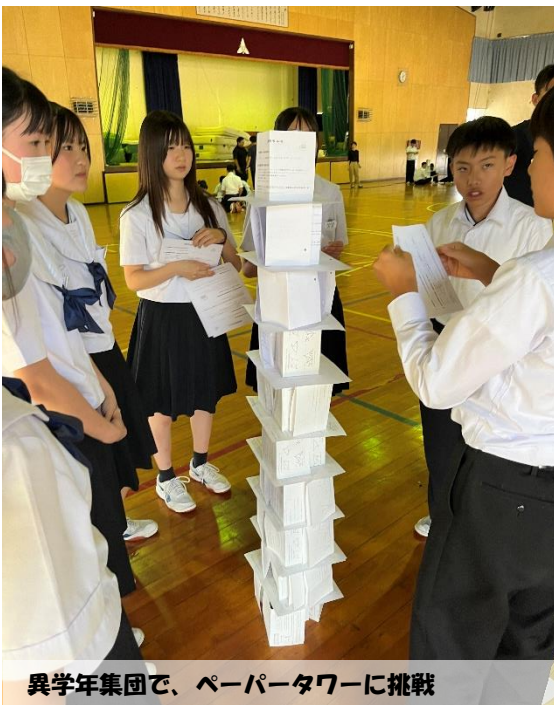
異学年集団で、ペーパータワーに挑戦