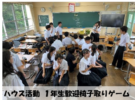
ハウス活動 1年生歓迎椅子取りゲーム