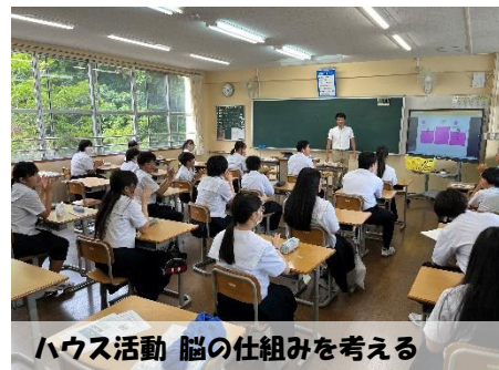
ハウス活動 脳の仕組みを考える