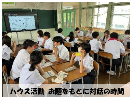
ハウス活動 お題をもとに対話の時間