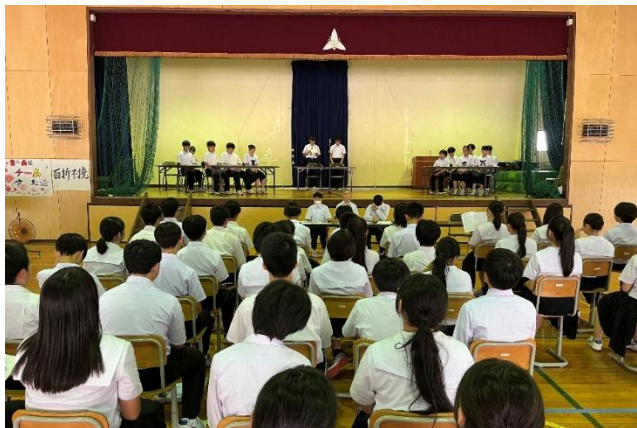
生徒会役員・3年生を中心に自分たちで進めた生徒総会