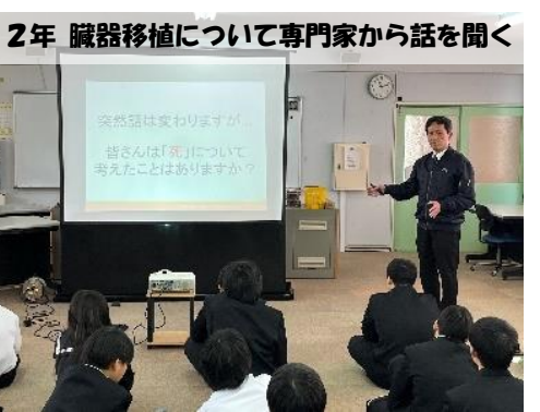
2年 臓器移植について専門家から話を聞く

どの学年でも「対話的・協働的な学び」を進めています。 学びの明確化 本校では、昨年末に行われた県学力状況調査の結果を参考にし、授業を行っています（個人票は返却していません）。授業では、 ①何を指すのか（ゴール、方向性） ②なぜやるのか（成長・体験・感情） ③どうやるのか（方法・ツール・順番） を、今後さらに明確にして進めていきます。これが、「個別最適な学び」につながります。 これからも、生徒、教員、そして保護者や地域の皆様と一緒に、白中の学びについて考えていきます。よろしくお願いたします。