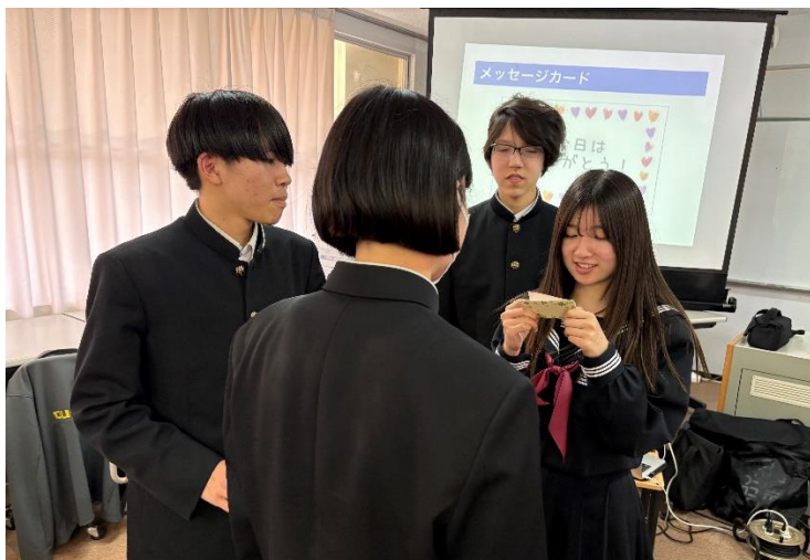
3年生「対話のフォークダンス」 言葉で伝えることの大切さ、ピンク言葉（肯定的にとらえた、ポジティブな言葉）の持つ力を体感