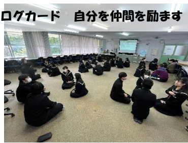
3年生 ウェルビーイングダイアログカード 自分を仲間を励ます