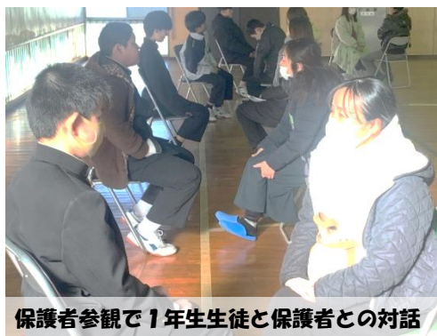
保護者参観で1年生生徒と保護者との対話