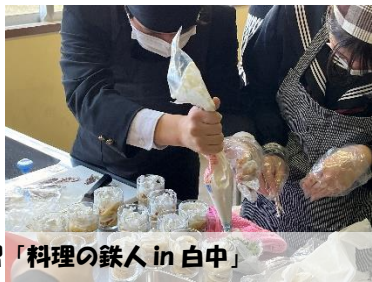
3年生 保護者も一緒に調理実習「料理の鉄人in白中」