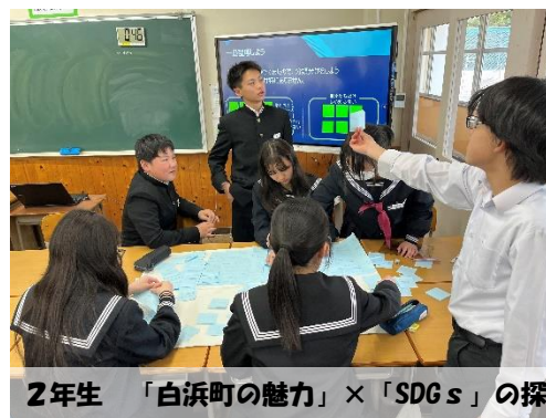
2年生 「白浜町の魅力」×「SDGs」の探求が始まりました