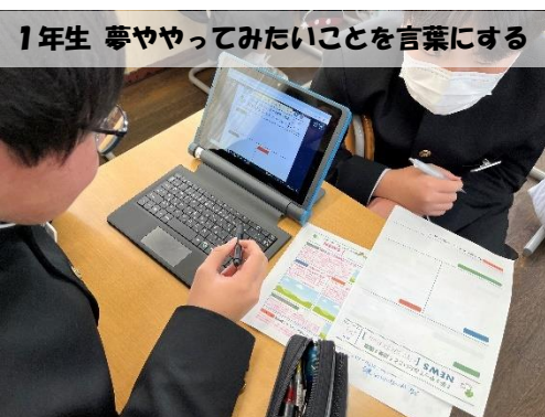
1年生 夢ややってみたいことを言葉にする