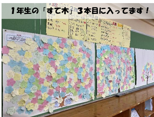
1年生の「すて木」3本目に入ってます！