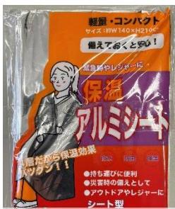
保温アルミシート