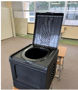
簡易トイレと消耗品

中学校の防災備蓄が整いました。生徒など100名分となります。簡易トイレと消耗品、保温アルミシートは白浜町公民館5分館からの寄付で、1日分の食料と水は、育友会費から整備させていただきました。ご寄付、ご協力をいただき、有り難うございました。